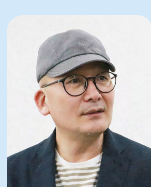
이수광 경기도교육연구원 원장